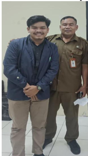
Gambar Informan 1