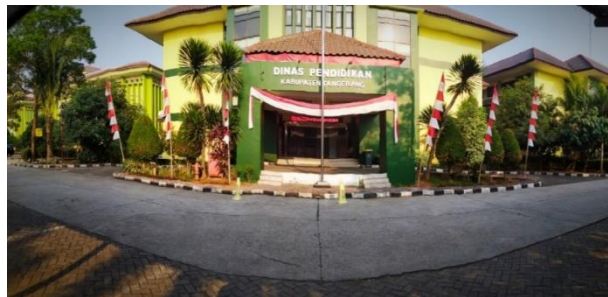
Gambar Tempat Penelitian Foto Dinas Pendidikan Kabupaten Tangerang Sumber: https://tangerangkab.go.id/disdik

Nama satuan organisasi mengalami perubahan sebanyak 6 (enam) kali; sampai dengan akhir tahun 1997 bernama Departemen Pendidikan dan Kebudayaan (Depdikbud), pada awal tahun 1998 sampai dengan pertengahan tahun 2000 diganti menjadi Departemen Pendidikan Nasional (Depdiknas), pada akhir tahun 2000 bernama DINAS PENDIDIKAN KABUPATEN TANGERANG sesuai dengan PERDA Nomor 11 Tahun 2000 serta pada awal tahun 2004 menjadi DINAS PENDIDIKAN DAN KEBUDAYAAN KABUPATEN TANGERANG. Pada Tahun 2008 dengan PERDA Nomor 02 Tahun 2008 menjadi DINAS PENDIDIKAN.