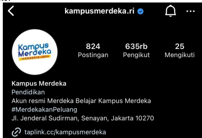
Gambar 1. Pengikut Akun Instagram @kampusmerdeka.ri

Pada penelitian ini penulis mengambil populasi berdasarkan jumlah populasi pengikut (followers) akun Instagram @kampusmerdeka.ri yang berjumlah 635.480 dan merupakan mahasiswa dari seluruh perguruan tinggi di Indonesia. Pengikut yang diambil pada tanggal 6 Juni 2023 menggunakan web livecuts.io dan kemungkinan jumlah ini dapat terus bertambah atau berkurang. Oleh karena itu, penulis menentukan bahwa populasi dalam penelitian ini adalah tak terhingga atau infinite.