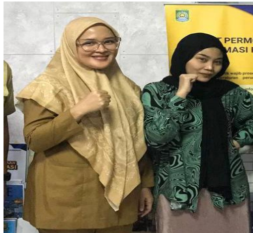
Gambar Informan 1

Jabatan : Kasi Pengembangan dan Kemitraan Komunikasi Publik di Dinas Komunikasi dan Informatika Kota Tangerang