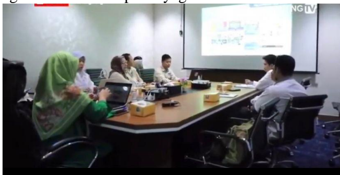
Gambar Rumah KIM Tangerang

Upaya pemberdayaan antara lain dilakukan dengan mendorong kelompok-kelompok masyarakat untuk mendayagunakan informasi agar meberikan nilai tambah bagi kehidupan masyarakat. Dalam konsep ini bagaimana pemberdayaan terjadi melalui proses peningkatan kesadaran akan pentingnya informasi, peningkatan akses dan pendayagunaan informasi tersebut melalui kelompok.