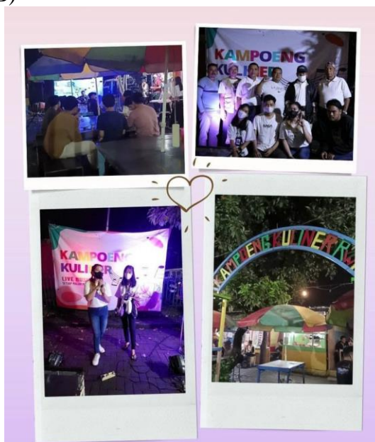
Gambar Program Rumah KIM

ekonomi pedesaan, peningkatan ekspor nonmigas, serta peningkatan Produk Domestik Bruto (PDB)