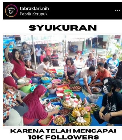
Gambar 2 Salah Satu Bentuk Unggahan Band hardcore Tabrak Lari di Instagram