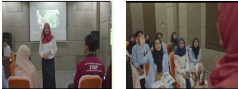
Gambar 1.1 : Ruang Audio Visual

Rumah Pintar Pemilu Sriwijaya memiliki sasaran yang meliputi segala segmen masyarakat namun saat ini lebih sering mengundang segmen dari pemilih pemula dan pemilih muda seperti siswa sekolah dan mahasiswa. Rumah Pintar Pemilu Sriwijaya memiliki beragam fasilitas yang terdiri dari ruang tunggu, ruang audio visual, ruang display, ruang simulasi dan ruang diskusi. Rumah Pintar Pemilu menyediakan berbagai materi-materi yang terdiri dari sejarah pemilu, tahapan pemilu, dan juga materi-materi mengenai pemilihan.