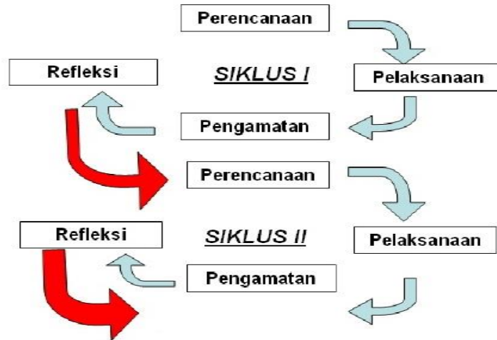
Gambar 2.

Adapun desain penelitian tindakan kelas yang akan dilaksanakan digambarkan sebagai berikut: