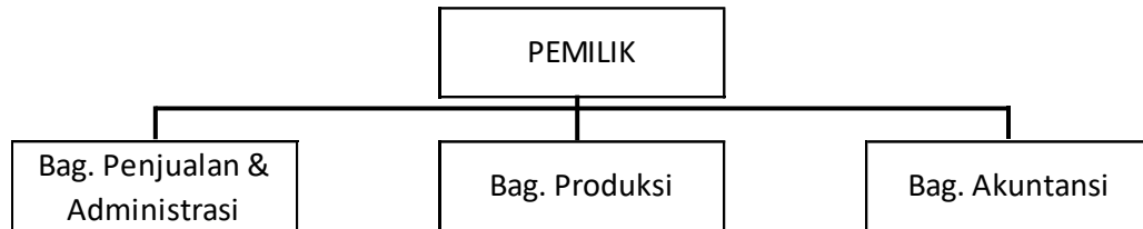
Gambar 1. Rancangan Struktur Organisasi RAFA Furniture & Interior

Perlu adanya rekrutment pekerja kembali untuk bagian keuangan yang memiliki kendali atas penyusunan laporan keuangan. Pemilik juga memiliki otorisasi dan supervise atas aktivitas pembelian bahan baku, pembuatan, dan pengiriman produk. Dalam hal ini telah dirancang struktur organisasi berdasarkan yang sebelumnya sudah dijalankan dan disesuaikan dengan beberapa perbaikan guna memaksimalkan pemanfaatan sumber daya manusia serta pengendalian internal yang lebih baik. Berikut struktur organisasi yang diusulkan pada Usaha Rafa Furniture & Interior :