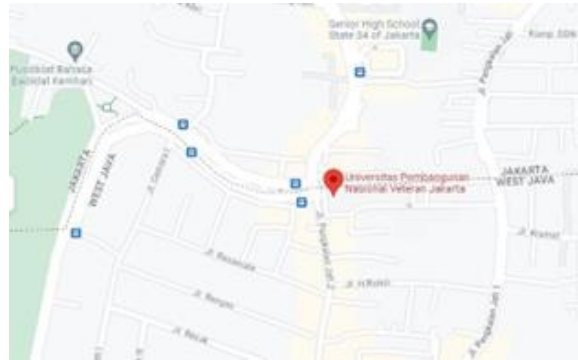
Gambar 1. Lokasi Penelitian

Pertama, Survei angket dilaksanakan untuk mengumpulkan data kuantitatif tentang pandangan mahasiswa/i Fakultas Hukum UPNVJ terkait infrastruktur lahan parkir. Sejumlah 17 responden mengisi angket dengan pertanyaan yang mencakup ketersediaan parkir, kesulitan dalam menemukan tempat parkir, dan persepsi mereka mengenai pemerataan pembangunan parkir. Hasil survei angket diolah dan dianalisis untuk mengidentifikasi tren dan pola yang muncul.