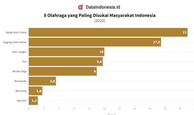
Gambar 2. Olahraga yang paling disukai masyarakat

Salah satu sosial media terbesar di Indonesia sendiri adalah Instagram. Sebelum diakuisisi oleh Facebook, Instagram adalah sosial media terpopuler di era 2015-an hingga saat ini. Instagram sendiri adalah salah satu media sosial untuk membagikan momen seperti foto dan video. Tetapi, pada saat ini Instagram sudah menjadi berkembang dan memiliki banyak fitur seperti instastory , direct message , IGTV , Reels , dll. Komunikasi antar sesama pengguna instagram dapat terjalin dengan adanya fitur memberikan tanda suka ataupun berinteraksi dengan komentar pada foto orang lain yang diunggah pada instagram tersebut (Nabila, 2016).