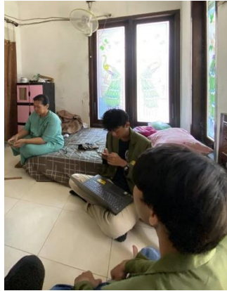
Gambar 3. Pembuatan NIB secara mandiri pada UMKM