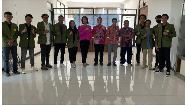
Gambar 1. Permohonan izin kepada pihak Kelurahan Kalirungkut