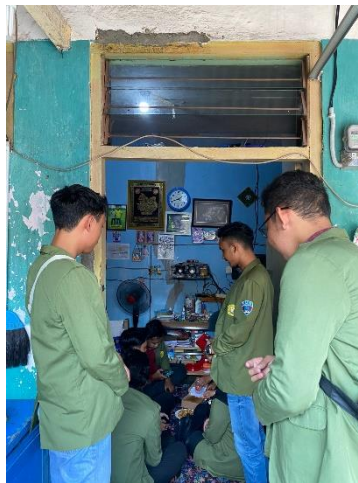
Gambar 2. Survey kerumah UMKM dengan metode door to door