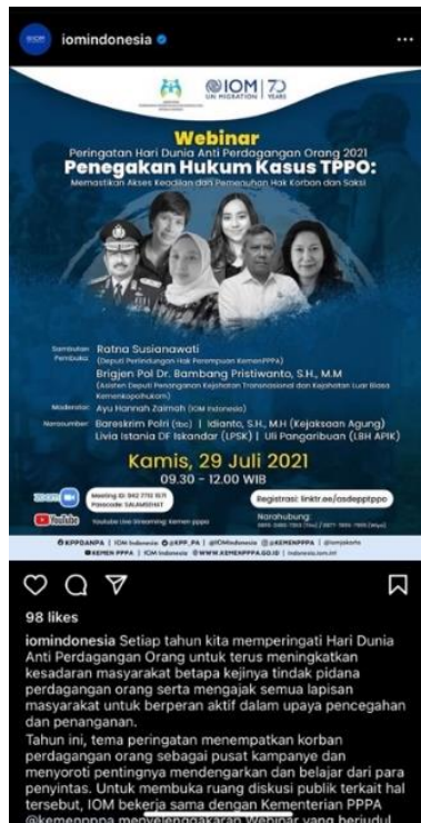
Gambar 2 : Poster Sesi Pemotretan Setelah Webinar Hari Dunia Anti Perdagangan Orang pada tahun 2021