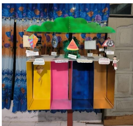
Gambar 1. Dokumentasi media pembelajaran Pohon Geometri

Media pembelajaran Pohon Geometri ini didesain memiliki 8 bilik sebagai tempat dari tiap bangun datar. Sekat-sekat ini diberi warna warni agar terlihat menarik. Dalam tiap sekat memiliki bentuk-bentuk bangun datar yang terbuat dari akrilik dengan ukuran yang bervariasi. Pada bagian atas Pohon digantung gambar-gambar benda konkret yang mewakili tiap bangun datar. Benda tersebut juga dilengkapi dengan tulisan dan Bahasa isyarat dari pengajar. Tiap benda yang digantung bisa dilepas pasang untuk memudahkan nantinya ada penambahan gambar-gambar. Benda-benda konkret yang digunakan berdasar benda-benda yang sering kali dijumpai siswa dalam kesehariannya. Hal ini untuk menambah kosakata siswa tuna rungu sehingga berpengaruh akan komunikasinya. Bentuk media pembelajaran Pohon Geometri dapat dilihat pada Gambar 1 dibawah ini.