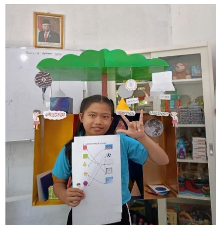
Gambar 2. Dokumentasi pembelajaran siswa tuna rungu & Pohon Geometri