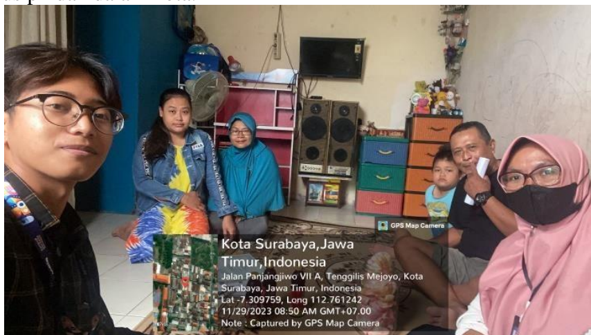
Gambar 3. Outreach Pindah Datang

Kegiatan survey wajib didampingi oleh RT setempat. Diperlukannya dampingan dari RT dikarenakan agar RT tersebut mengetahui bahwa ada warga baru yang datang masuk ke RT tersebut. Selanjutnya Pemohon mengajukan permohonan pindah dalam kota dibantu oleh kelurahan untuk mendaftarkan proses permohonan. Setelah selesai mengisi semua data, Kemudian Pemohon akan menggunggah semua dokumen persyaratan dalam satu format pdf kemudian akan dibantu staff kelurahan pada aplikasi Klampid New Generation (KNG). Setelah itu, Pemohon akan menerima ekitir sebagai tanda bukti bahwa sudah mengurus pindah dalam kota.