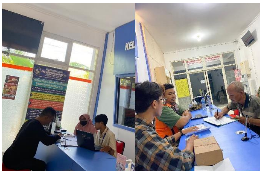
Gambar 2. Pelayanan Konsultasi Pindah Dalam Kota di Kelurahan Panjang Jiwo