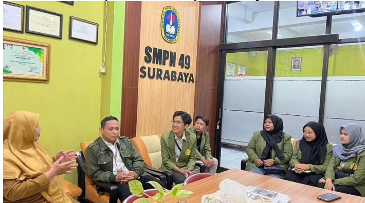
Gambar 1. Survey SMP Negeri 49

Observasi lokasi merupakan langkah awal dalam mendapatkan pemahaman mengenai kondisi fisik, keberlangsungan, dan potensi sebuah lingkungan, dalam hal ini SMPN 49 Surabaya. Melalui proses observasi ini, kami mencari informasi ke pihak sekolah untuk mengetahui informasi yang kami butuhkan. Dengan adanya survei lokasi ini, kami jadi mengetahui bahwa SMP Negeri 49 membutuhkan bazar kewirausahaan, karena para siswa telah mendapatkan pelajaran kewirausahaan tetapi belum ada praktek nyata.