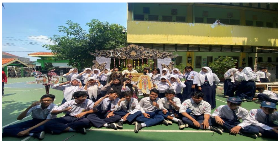
Gambar 6. Juara Stand Bazar Kelas 9D