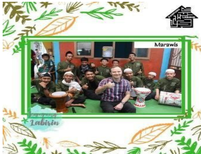
Gambar A.4. Tim Marawis