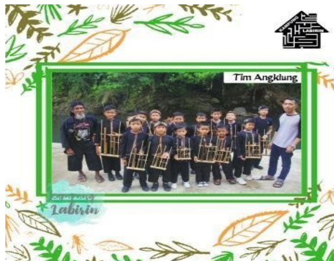
Gambar A.3. Tim Angklung