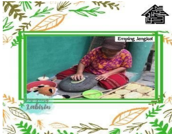
Gambar A.2. Pembuatan Emping Jengkol

Selain emping jengkol warga sekitar memproduksi kripik jengkol dengan varian rasa seperti rasa : pedas dan balado.