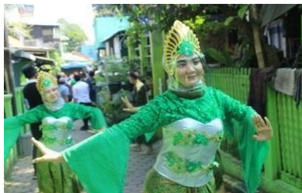
Gambar A.5. Tim Tari Daerah