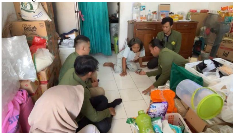
Gambar.1 Melakukan sosialisasi dan edukasi dalam pembuatan NIB

Berdasarkan Peraturan Pemerintahan Nomor 24 Tahun 2018 Pasal 25 Ayat (1) mengenai Pelayanan Perizinan Berusaha Terintegrasi Secara Elektronik atau Online Single Submission (OSS), dijelaskan bahwa Nomor Induk Berusaha (NIB) merupakan identifikasi yang diberikan kepada Pelaku Usaha untuk mengoperasikan usahanya sesuai dengan ketentuan yang berlaku. (Tafrilyanto et al., 2023). OSS merupakan system perizinan usaha, sistem OSS yang dikembangkan dan dijalankan oleh Pemerintah Pusat adalah platform terpadu yang menjadi pedoman utama dalam kegiatan bisnis. Salah satu kelebihan dari sistem OSS adalah penyediaan penyimpanan data yang terintegrasi dengan Nomor Induk Berusaha (NIB). Oleh karena itu, mendapatkan NIB melalui sistem OSS dapat dilakukan tanpa dikenakan biaya tambahan atau gratis.