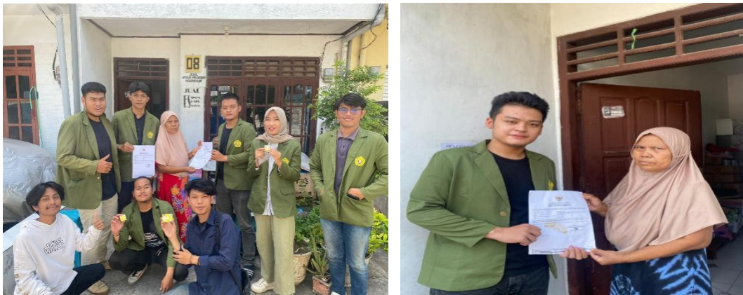
Gambar.3 Penyerahan Berkas Cetak NIB Kepada UMKM “Mega Salad”

Pada tahap ketiga, menjelaskan prinsip-prinsip dasar penggunaan situs web OSS secara langsung, yang dimulai dengan memberikan sertifikasi NIB kepada UMKM Mega Salad dan menjelaskan kepada pelaku usaha potensi manfaat-manfaat setelah memiliki NIB.