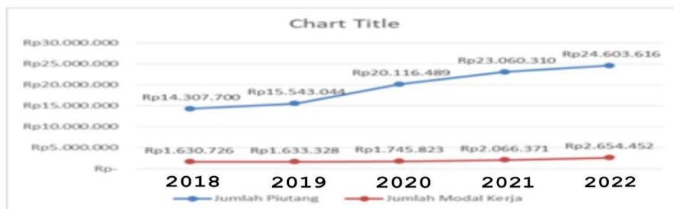
Gambar 1 Grafik Jumlah Piutang dan Modal Kerja

Hasil menunjukkan bahwa peningkatan piutang tak tertagih pada PT. Pegadaian Persero setiap tahun. Hal ini disebabkan oleh faktor internal dan eksternal. Faktor internal di karenakan terlalu mudah bagi perusahaan untuk memberikan piutang akibat tidak adanya parameter tentang tingkatan kekayaan debitur. Faktor eksternal terjadi karena keadaan ekonomi masyarakat menurun karena harga bahan pokok tidak stabil.