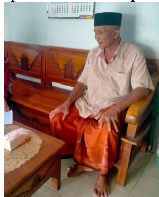
Gambar 2. Kunjungan kepada Kepala RT wilayah setempat

permasalahan data kependudukan wilayah kunir. Dikarenakan beliau merupakan seseorang yang membawahi satu kecamatan yaitu Kecamatan Kunir kependudukan yang terjadi di wilayah Kunir. Dalam pertemuan ini didapat informasi dari KOSEKA Kunir diperkirakan jumlah penduduk Kunir Lor yang tidak memiliki KTP berkisar kurang lebih 14 orang dilihat dari Sensus Penduduk 2020 tetapi beliau juga berucap “berjalan dengan waktu mulai SP2020 sampai tahun 2023 ini mulai menurun jumlah penduduk yang tidak memiliki KTP dikarenakan adanya syarat untuk mendapatkan bantuan diwajibkan memiliki KTP guna data penerima bantuan namun tidak dapat dipastikan berapa sisa penduduk yang masih tidak memiliki KTP” dapat dimungkinkan karena adanya aturan tersebut menjadikan mereka untuk cepat buat mengurus KTP guna mendapatkan bantuan. Dengan pernyataan tersebut yang turun dari ucapan langsung oleh KOSEKA Kunir menjadikan patokan hasil dari penelitian ini.