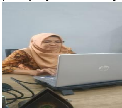
Gambar 1. Pengunjungan ke BPS Lumajang

Dalam proses penelitian ini yang berupa sosialisasi kepada muda/mudi Daerah Kunir Lor terkait masyarakat setempat yang tidak memiliki KTP. Tidak ada kepemilikan KTP ini rata-rata adalah mereka orang yang memiliki usia lanjut dengan kondisi sebatang kara dan relatif memiliki rumah daerah yang jauh dari pemukiman warga alias samping kebunnya sendiri. Didukung dengan warga Lumajang yang umumnya menjadi petani sawah dan petani kebun.