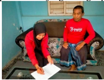
Gambar 4. Kunjungan Door to Door kepada warga yang tidak memiliki KTP guna dicatat/didata.

Kegiatan sosialisasi ini dilakukan secara sekali dengan dihadirkan oleh KOSEKA (Koordinator Sensus Kecamatan) serta muda/mudi daerah Kunir Lor memungkinkan untuk berbagi informasi terkait berapa kira-kira penduduk yang tidak memiliki KTP. Para muda mudi karang taruna setempat diajak untuk melakukan kolaborasi atau kerja sama terkait pendataan kembali penduduk Wilayah Kunir Lor yang tidak mempunyai KTP. Dalam meet tersebut para muda mudi karang taruna dibina secara langsung oleh KOSEKA Kunir terkait dengan pentingnya suatu data kependudukan dengan berjalannya pendataan statistik oleh BPS Lumajang. Sangat disayangkan ternyata penduduk Kunir Lor yang masih belum memiliki KTP masih tergolong cukup banyak sekitar 13 orang didominasi oleh lansia yang hidup sebatang kara yang berprofesi sebagai petani sawah/kebun. Diharapkan para muda mudi karang taruna setempat dapat mengetahui apa pentingnya suatu data kependudukan dan nantinya para muda mudi akan diajak langsung terjun kepada rumah warga yang tidak memiliki KTP guna mendata supaya bisa segera dilaporkan ke Kepala Desa/Sekdes Kunir Lor guna bisa langsung diterima dan diharapkan dapat segera diurus oleh pihak Pemerintahan Desa kepada Dispenduk Kabupaten Lumajang. sebagai petani sawah/kebun.