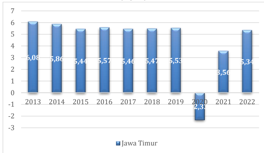
Gambar 1. Persentase Pertumbuhan Ekonomi Di Provinsi Jawa Timur Tahun 2013-2022