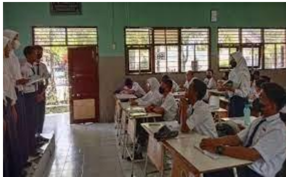
Gambar 2. Tahapan Kurikulum Merdeka

Profil Pelajar Pancasila berperan dalam memandu dan menentukan arah segala kebijakan dan pembaharuan dalam sistem pendidikan Indonesia, termasuk pembelajaran, dan asesmen. P5 adalah yaitu pembelajaran lintas disiplin ilmu dalam mengamati dan memikirkan solusi terhadap permasalahan di lingkungan sekitar untuk menguatkan berbagai kompetensi dalam Profil Pelajar Pancasila.