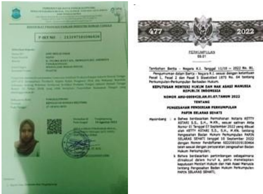
Gambar 3. Dokumen Sertifikasi Halal, NIB, P-IRT, Akta Notaris dan SK KEMENKUMHAM

Legalitas usaha juga diperlukan di dalam pengemasan produk yang mana pengemasan merupakan aktivitas merancang dan memproduksi kemasan atau pembungkus untuk produk. Biasanya fungsi utama dari kemasan adalah untuk menjaga produk. Namun, sekarang kemasan menjadi faktor yang cukup penting sebagai alat pemasaran (Rangkuti, 2010:132). Hasil dari adanya legalitas pada usaha Jahe Merah Omar adalah usahanya semakin berkembang, pasarnya semakin luas ke pasar lokal. Dari aspek pengemasan setelah melakukan legalitas produk, desain stiker pada kemasan produk semakin lengkap dengan menyertai nomor legalitas dan terdaftar halal. Hal ini berpengaruh terhadap penjualan juga dikarenakan dengan adanya legalitas para konsumen semakin yakin dengan produk tersebut.