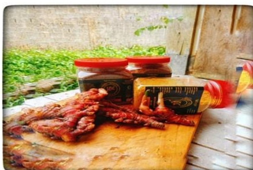
Gambar 2. Jahe Merah Omar