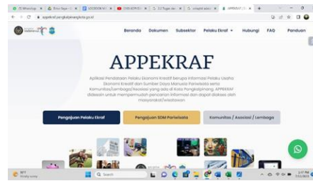
Gambar 4. Aplikasi Pelaku Usaha Ekonomi Kreatif Kota Pangkalpinang)