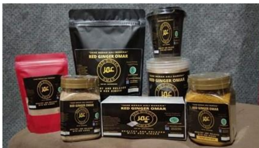
Gambar 1. Jahe Merah Omar

memiliki legalitas, lalu pada setelah 1 (satu) tahun, pemilik usaha mulai mengurus legalitas usahanya.