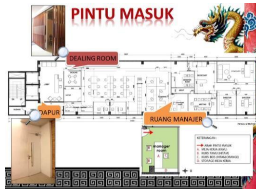
Gambar 6. Pintu masuk ruangan.

Secara kaidah Feng Shui, kedua pintu masuk gedung utama dan pintu masuk ruangan telah diatur dengan tepat. Menurut prinsip Feng Shui, pintu masuk yang baik seharusnya berlokasi di sisi yang dihubungkan dengan simbol Naga (Timur) atau Selatan. Dalam pandangan Feng Shui, pintu masuk yang diinginkan memiliki ketinggian yang tidak menyentuh plafon. Contoh pintu masuk dapur dalam Gambar 6 adalah salah satunya. Selain itu, pintu masuk sebaiknya tidak berada dalam posisi yang langsung berhadapan dengan meja kerja, seperti yang tampak pada pintu ruang manajer dalam Gambar 6, untuk mencegah Chi yang masuk ke ruangan tidak secara langsung mengenai meja kerja (yang disebut "panah beracun"). Di sisi lain, pintu masuk yang tingginya menyentuh plafon, seperti yang terlihat pada pintu dealingroom dalam Gambar 6, dianggap kurang menguntungkan karena bisa menekan aliran Chi yang melewati di bawahnya. Oleh karena itu, disarankan agar pintu yang tingginya menyentuh plafon diganti dengan pintu standar.