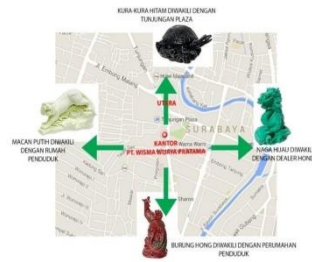
Gambar2. Lokasi Gedung Perkantoran B

Begitu pula dengan pabrik di sisi timur kantor (sebelah jalan utama) yang beroperasi untuk menangkis Sha Chi. Bentuk bangunannya persegi panjang, yang menurut Fengshui merupakan bentukan yang kokoh, dan berorientasi kokoh ke atas.