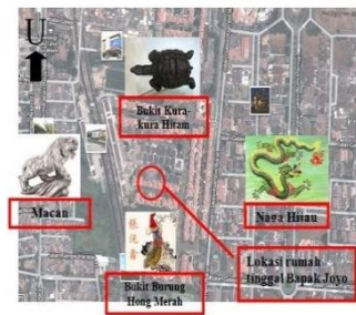
Gambar1. Lokasi Gedung A

Menurut prinsip Feng Shui, tempat kediaman Pak Joyo memiliki posisi yang sangat menguntungkan dengan aliran energi Chi yang positif. Menurut ajaran Feng Shui, lanskap Phoenix Merah di sekitarnya harus memiliki ciri terbuka dan datar. Dalam pandangan Feng Shui, adanya sumber air di depan rumah dianggap sebagai faktor yang mendatangkan keberuntungan, karena air diyakini membawa peluang-peluang yang berlimpah. Dalam konteks ini, air yang dimaksud adalah air yang memiliki gerakan, kebersihan, dan dinamika. Dalam terminologi Feng Shui, aliran air di depan rumah dikenal sebagai "Naga Air"; peran air ini adalah untuk menarik dan mengumpulkan energi Chi yang positif [8].