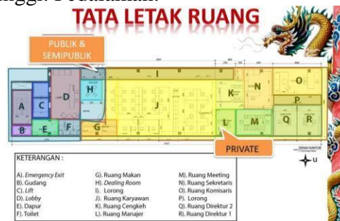
Gambar 5. Tata letak ruang berdasarkan zoning.

Secara keseluruhan, penataan ruangan telah diatur sesuai dengan prinsip-prinsip Feng Shui. Ruangan disesuaikan dengan fungsi masing-masing serta ditempatkan di sektor yang sesuai, dengan harapan akan membawa dampak positif bagi kantor. Contoh dalam Gambar 5 mengilustrasikan penempatan ruang komisaris (dilingkari kotak hijau) yang tepat pada sektor kepemimpinan dan kreativitas, mengingat seorang pemilik perusahaan atau pimpinan perlu memiliki tingkat kepemimpinan dan kreativitas yang tinggi. Pedalaman: