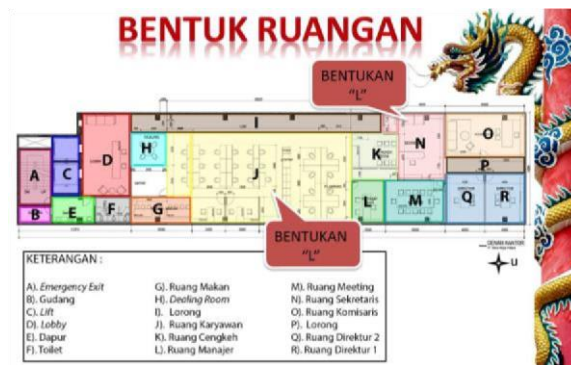
Gambar3. Rencana kantor