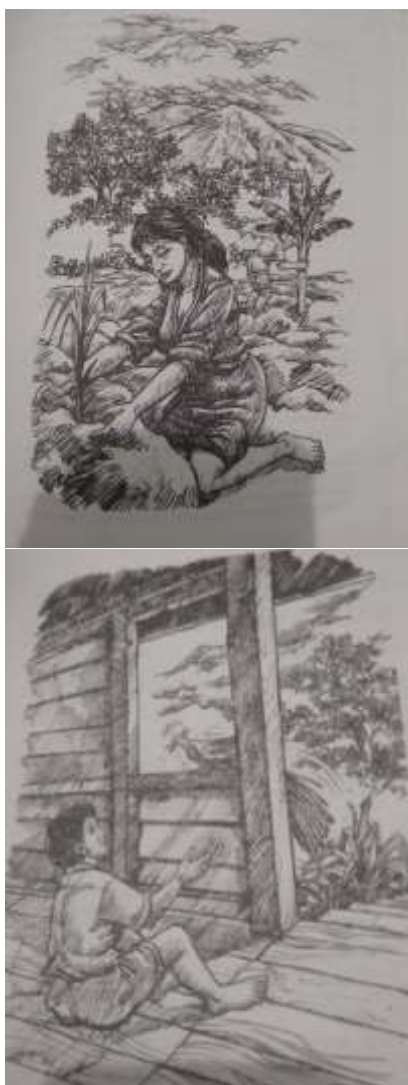
Gambar 2. Gambar cerita rakyat

Berdasarkan tes setelah diberikan perlakuan dengan metode picture to picture maka dapat dirangkum hasil rata-rata adalah sebagai berikut :