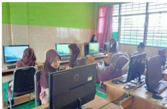
Gambar 4: Uji Coba Kelompok Kecil E-LKPD

Berdasarkan hasil survey di SDN Curahgrinting 3 dalam pembelajaran matematika materi pola bilangan bahwa siswa kesulitan memahami dan siswa cenderung pasif pada saat pembelajaran. Kondisi kelas yang kurang menyenangkan dan suasana pembelajaran yang cenderung pasif tersebut membuat siswa merasa bosan, sehingga berdampak pada pemahaman siswa pada materi yang dijelaskan sulit dipahami.