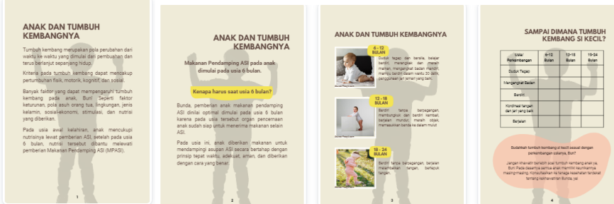
Gambar 5 Materi: Tumbuh Kembang Anak