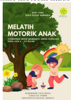
Gambar 1 Sampul Bagian Depan

Hasil peneliti ini berupa media buku saku yang berisi tentang informasi tumbuh kembang anak usia MPASI, gangguan penerimaan makan, pendidikan montessori, pentingnya stimulasi motorik anak, dan permainan yang dapat menstimulasi motorik halus pada anak.