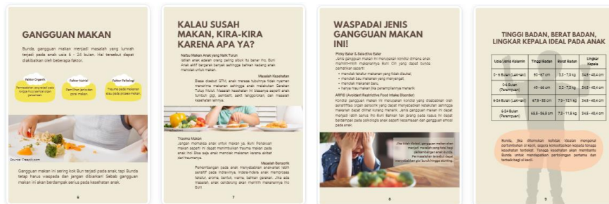
Gambar 6 Materi: Gangguan Penerimaan Makan