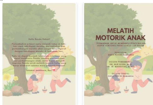
Gambar 2 Sampul Bayangan