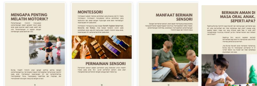
Gambar 7 Materi: Metode Montessori dan Sensori