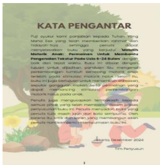
Gambar 3 Kata Pengantar