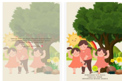
Gambar 11 Sampul Bagian Belakang