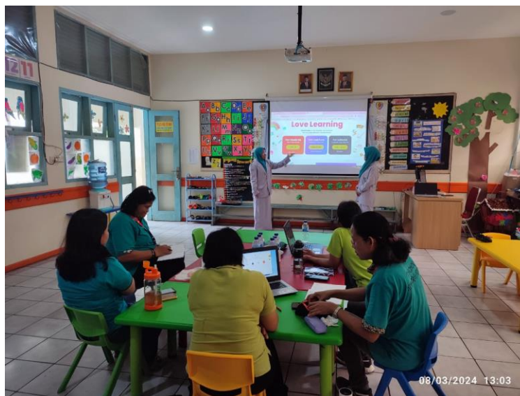
Gambar 1. Penjelasan Umum Book Creator

Pada saat pelaksanaan dilakukan terlebih dahulu sambutan untuk kepala sekolah dan guru yang hadir menjadi peserta pelatihan, setelah itu kami melakukan penjelasan secara umum mengenai Book Creator yang akan kami kenalkan kepada guru bersamaan menjelaskan alasan mengapa kami melakukan pelatihan mengenai Book Creator . Kemudian kami menjelaskan mengenai menyiapkan akun dalam Book Creator yang memiliki tiga jenis yaitu log in sebagai murid, log in sebagai guru, dan log in sebagai pengelola sekolah, pada pelatihan ini kami hanya menjelaskan secara detail jenis log in sebagai guru, pada tahap ini guru diminta untuk log in sebagai guru menggunakan akun google yang dimiliki. Terlihat para guru sangat fokus memperhatikan dan mencatat penjelasan umum mengenai Book Creator ini.