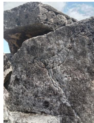
Motif burung perahu batu

Symbol altar batu atau yang disebut tempat duduk tuan tanah.