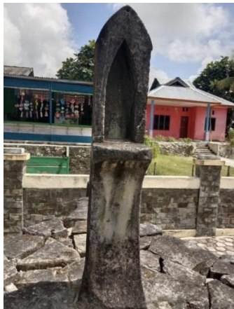
Batu berdiri pada buritan

barat tepat di depan buritan terdapat tugu batu (menhir) berbentuk meruncing pada bagian puncaknya dan terdapat ruang (ceruk).