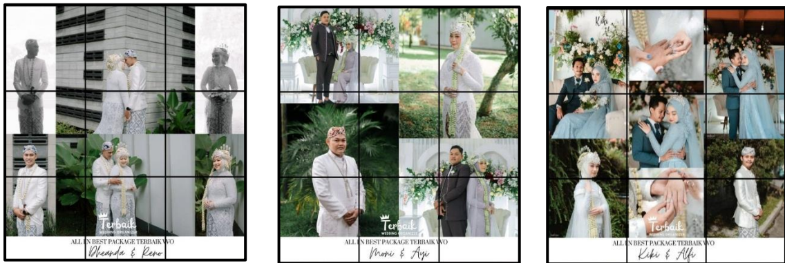
Gambar Hasil Foto Wedding Terbaik WO

Beberapa hasil foto Wedding yang pernah dikerjakan oleh Terbaik WO dapat dilihat pada gambar di bawah ini :