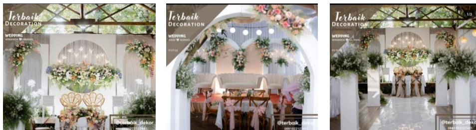
Gambar 4. 3 Layanan Dekorasi Dari Terbaik Dekor

Bedasarkan wawancara dengan Owner Terbaik WO yaitu teh Destia terkait strategi pelayanan Wedding Organizer (WO), ditemukan informasi bahwa strategi pelayanan ini berfokus pada pelayanan fisik, pelayanan keandalan, dan pelayanan empati (W1). Dalam pelayanan fisik, Kru Terbaik WO memastikan bahwa setiap aspek fisik dari pernikahan, seperti dekorasi, Catering , Kru WO dan ketersediaan fasilitas lainnya, memenuhi standar kualitas yang baik. Bedasarkan hasil observasi peneliti pada akun Instagram @terbaik_wo, @terbaik_dekor dan @terbaik_catering terkait Beberapa bukti fisik dari dekorasi, catering dan Pelayanan WO dapat dilihat pada gambar berikut :