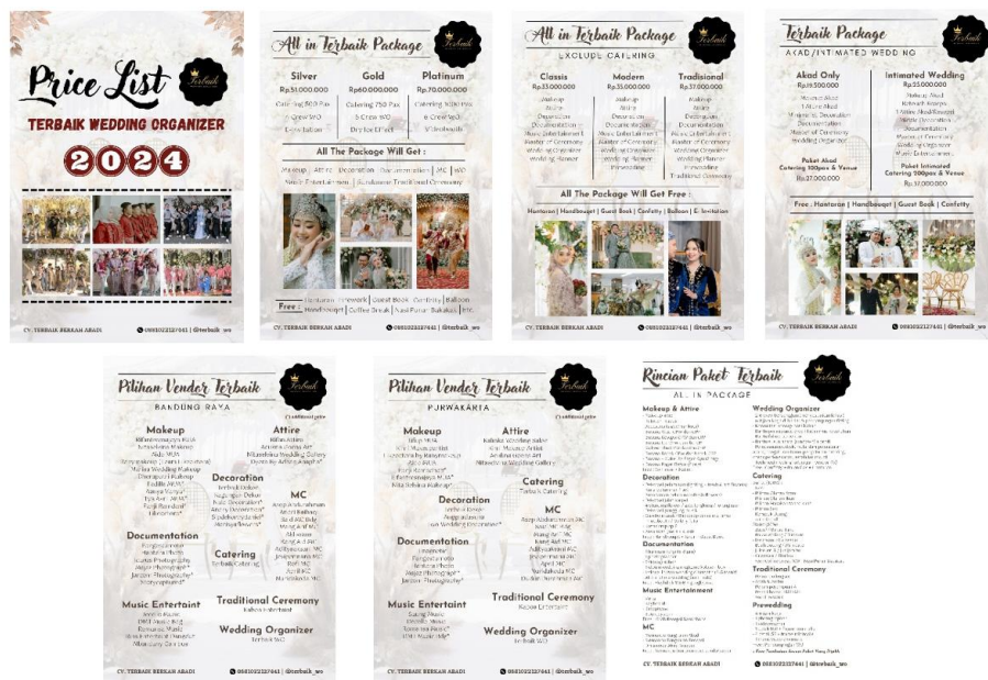
Gambar 1. 1 Paket Wedding Terbaik WO

Paket wedding yang tercantum di atas merupakan penawaran terbaru dari Terbaik Wedding Organizer . Meskipun sebenarnya ditujukan untuk tahun 2024, paket ini sudah aktif dipromosikan dan banyak digunakan oleh calon pengantin sejak bulan Juni 2023. Dari wawancara dengan Destia, Pemilik dan Pengelola Terbaik Wedding Organizer , terlihat bahwa minat konsumen tidak hanya dipengaruhi oleh produk yang ditawarkan, namun juga oleh strategi promosi dan kualitas layanan yang diberikan.