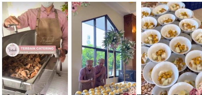
Gambar 4. 4 Layanan Catering Dari Terbaik Catering