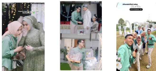
Gambar 4. 5 Layanan WO Dari Terbaik WO

Tim Terbaik WO berupaya menciptakan lingkungan pernikahan yang indah dan nyaman bagi pasangan dan tamu mereka. Pasangan secara aktif terlibat dalam proses perencanaan, memberikan masukan, persetujuan, dan mengevaluasi progres secara keseluruhan, menciptakan rasa kepemilikan yang kuat atas pernikahan mereka. Pelayanan keandalan menjadi prioritas utama, di mana setiap janji dan komitmen kepada pasangan dihormati dan dipenuhi tepat waktu. Mereka mengatasi