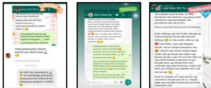
Gambar 4. 1 Testimoni Terbaik WO

Kemudian melalui media sosial juga Terbaik WO menunjukkan hasil testimoni konsumennya seperti gambar di bawah ini :