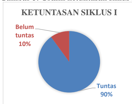
Gambar 3. Grafik ketuntasan siklus II

Berdasarkan tabel di atas presentasi ketuntasan klasikal belajar siswa siklus II sebagai berikut: