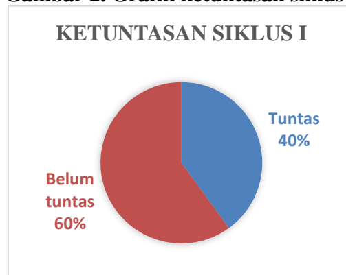
Gambar 2. Grafik ketuntasan siklus I

Ketuntasan klasikal belajar siswa siklus I sebagai berikut: