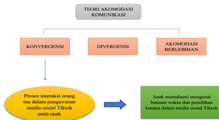
Gambar 2. Teori Akomodasi Komunikasi Komunikasi Verbal Anak Saat Menggunakan Media Sosial Tiktok

Salah satu dari ketiga premis dalam teori akomodasi yang pertama adalah mengenai divergensi, yang menjelaskan bagaimana pemilihan strategi dalam mengakomodasi supaya terjadinya kesepemahaman makna. Tentunya hal ini terdapat korelasi dimana orang tua memilih bagaimana cara menjalin komunikasi dengan anak sehingga anak memahami mengenai batasan penggunaan media sosial Tiktok.