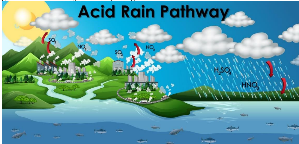
Gambar 1. Bagan Mekanisme Hujan Asam

telah tercampur dengan senyawa lain dari proses penguapan. Reaksi ini menghasilkan asam karbonat ( H_2CO_3 ), yang merupakan jenis asam lemah. Selain itu, gas yang dihasilkan dari pembakaran atau pemanasan belerang, seperti hidrogen sulfida ( H_2S ) dan sulfur oksida ( SO_2 ), akan bereaksi dengan uap air ( H_2O ) membentuk asam sulfat ( H_2SO_4 ), yang termasuk dalam jenis asam kuat. Disajikan bagan mekanisme hujan asam pada gambar di bawah ini :