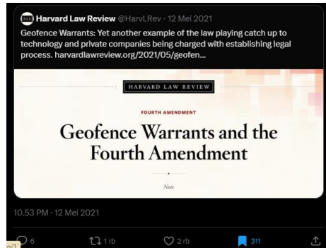
Gambar 2. Akun X Harvard Law Review

Pada tahun 2021, Harvard Law Review, jurnal hukum terkemuka yang terkait dengan Harvard Law School, merujuk BTS dan lagu Baepsae/Silver Spoon dalam footnote ke-177 di artikel tentang Geofence Warrants.