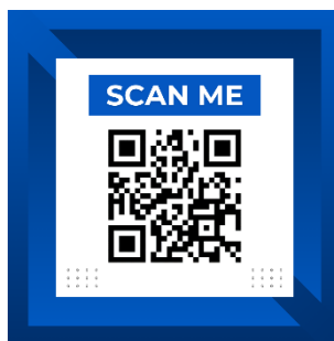
Gambar 1. Gambar Contoh Barcode Video Tutorial